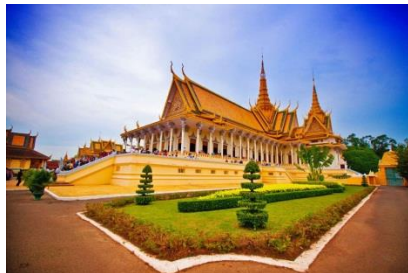
Tôi đã thăm cung vua

Tôi tìm tiếp và thấy bài thơ thứ hai cũng sáng tác năm 1984, đó là “ Bài thơ bên dòng sông Tônglê Sáp” Bài này ghi rõ địa điểm sáng tác là tại Đại học Sư phạm PhnomPenh.