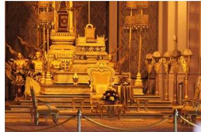
Nhưng đã chẳng thấy vua